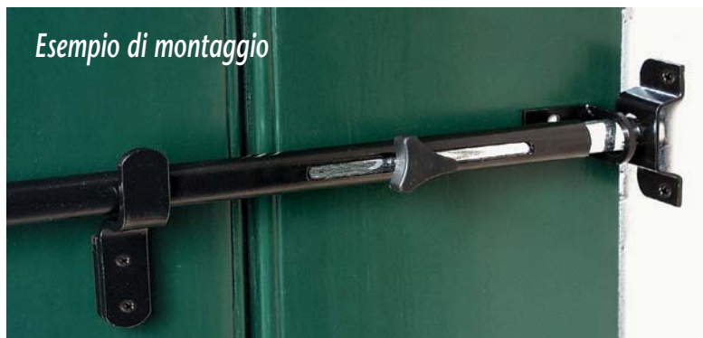
Esempio di montaggio